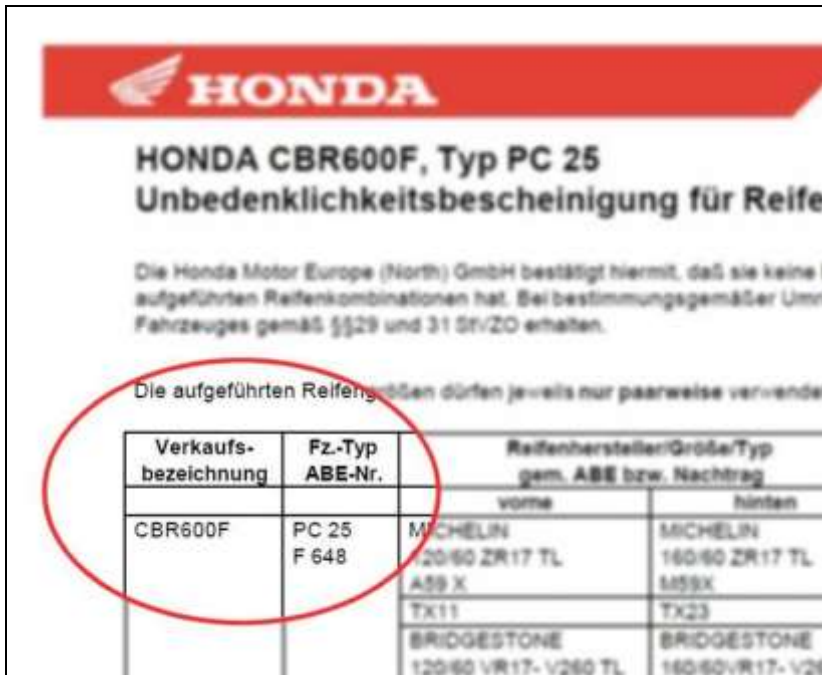
Bild 5 b: ...wiederfinden auf der Unbedenklichkeitsbescheinigung des Fahrzeug- und...