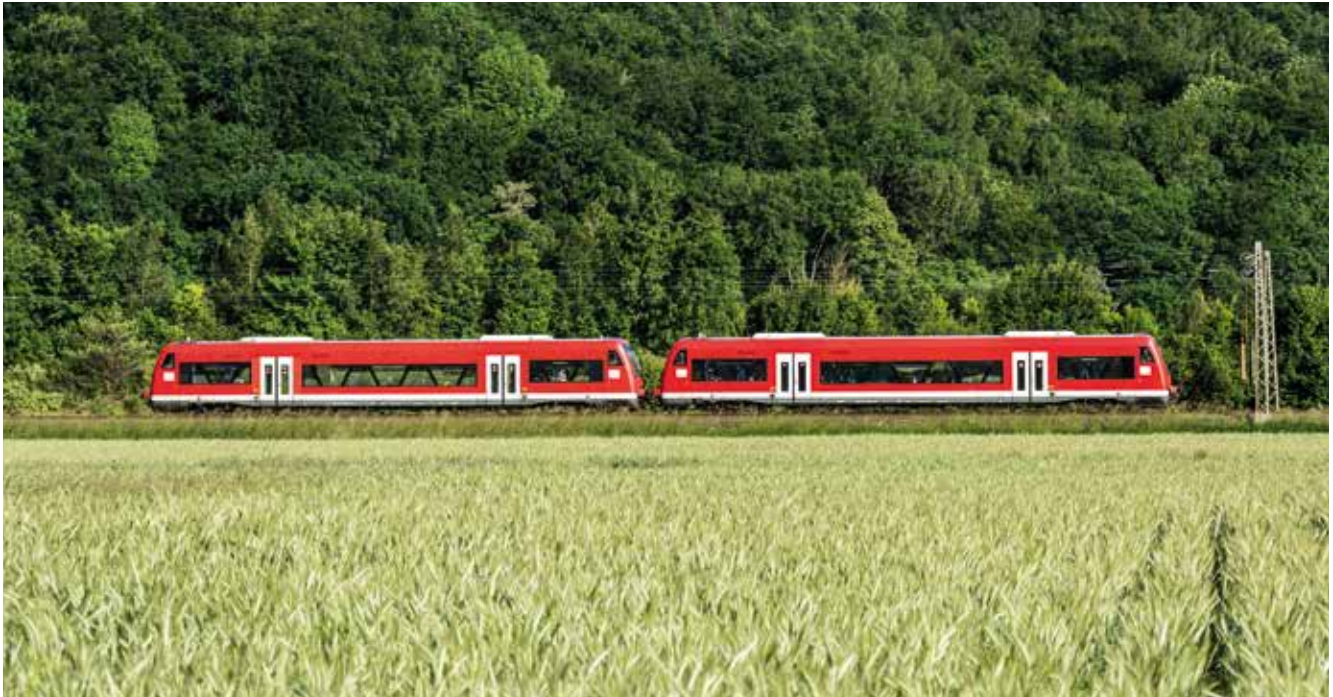
Züge sind ein geeignetes Verkehrsmittel für die Hauptachsen des ÖV.