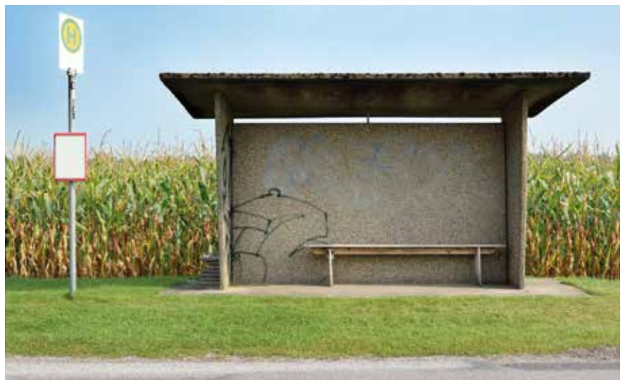
Aufgrund des demografischen Wandels wird die Entleerung des ländlichen Raums zunehmend ein Problem.