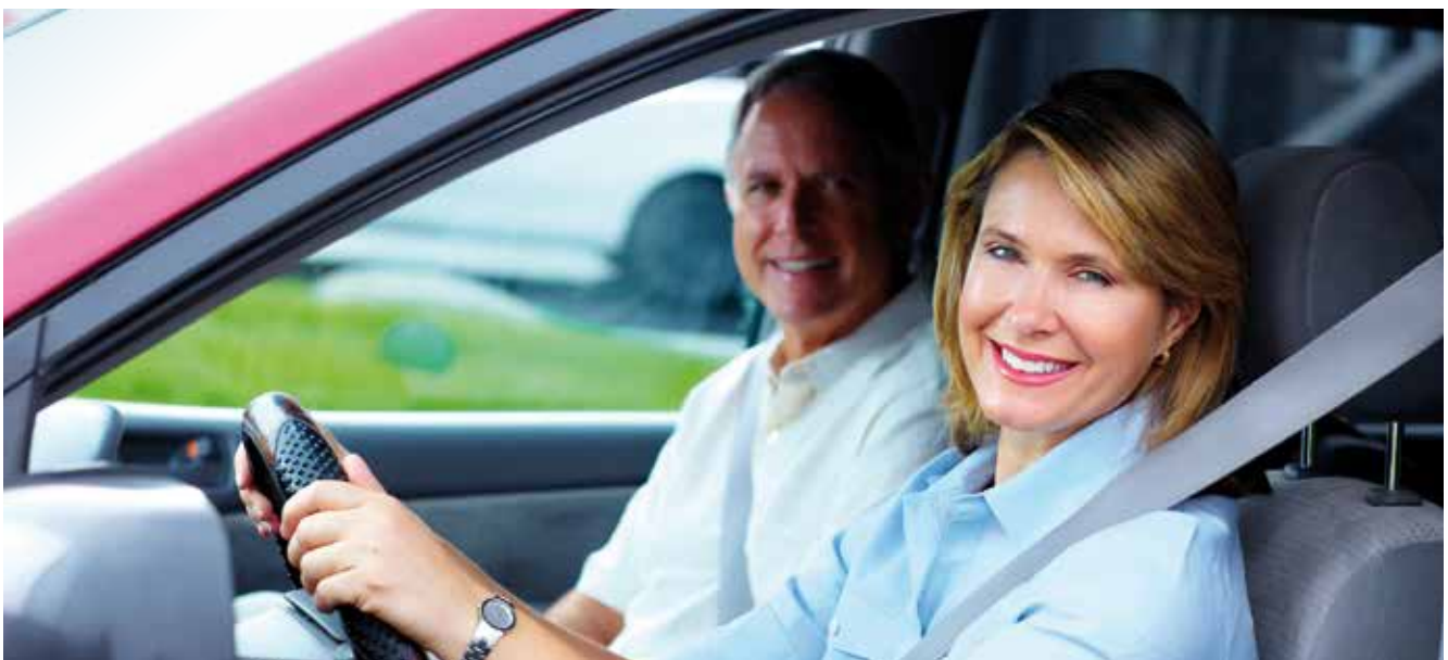
Mehr als die Hälfte aller Wege der Älteren werden im Pkw zurückgelegt.