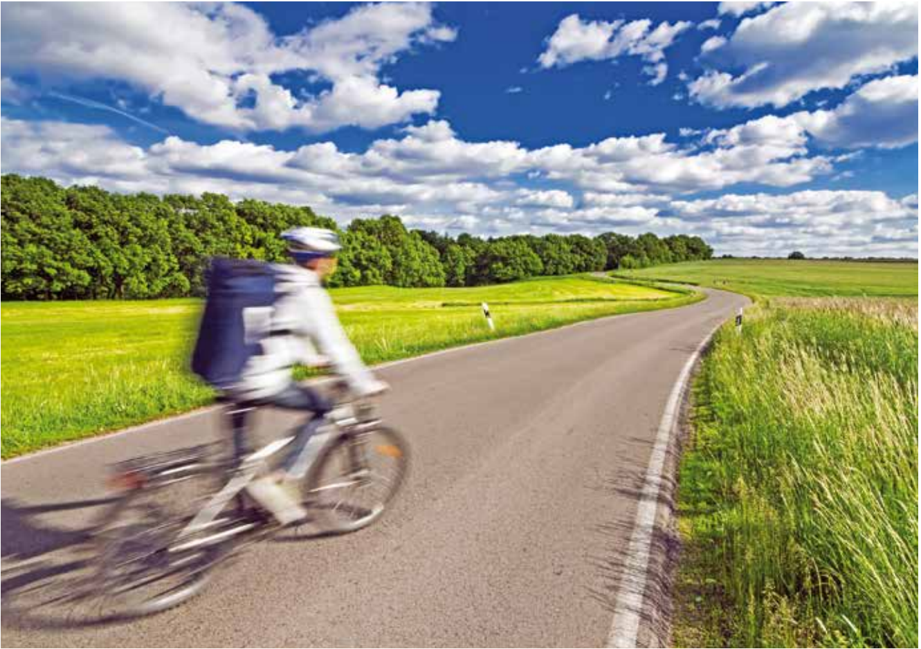
Besonders Elektrofahrräder lassen ein relevantes Wachstumspotenzial in der Mobilität Älterer erkennen.