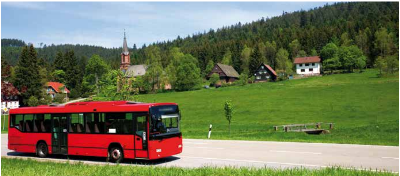
Für den klassischen Linienbetrieb ergeben sich zunehmend Tragfähigkeitsprobleme.

Dem motorisierten Individualverkehr (MIV) wird weiterhin eine führende Rolle bei der Mobilitätssicherung in ländlichen Räumen zukommen. Zunehmend werden – verstärkt durch Innovationen – multimodale (d.h. vernetzte) Mobilitätsangebote an Bedeutung gewinnen, die sich bislang vorrangig in Regionen mit hoher Bevölkerungsdichte etabliert haben.