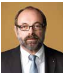
Ulrich Klaus Becker ADAC Vizepräsident für Verkehr

Der Mobilität kommt eine herausragende Bedeutung für die Daseinsvorsorge ebenso wie für Wachstum und Wohlstand in unserer Gesellschaft zu. Sie spielt eine zentrale Rolle für die Teilnahme der Menschen am sozialen Leben. Arbeitsplätze, Dienstleistungen aller Art und insbesondere Güter des täglichen Bedarfs sowie medizinische Versorgungseinrichtungen müssen erreichbar sein, um eine hohe Lebensqualität zu ermöglichen.