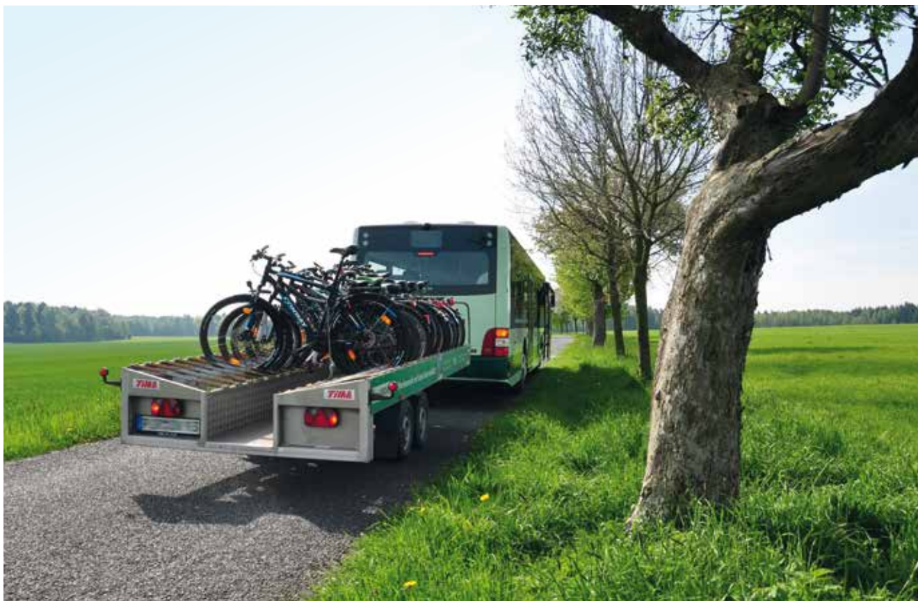
Die Möglichkeit der Fahrradmitnahme kann die Attraktivität des ÖV steigern.