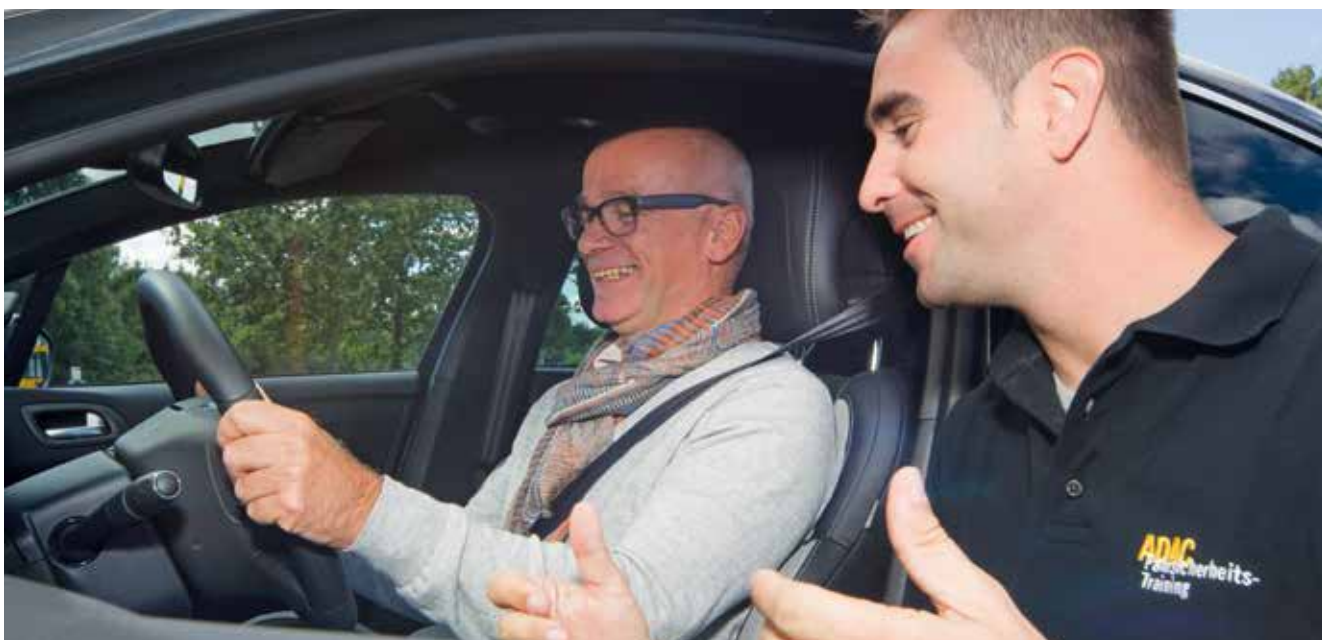
Die Erhaltung der Mobilität Älterer lässt sich durch Fahrtrainings verbessern.