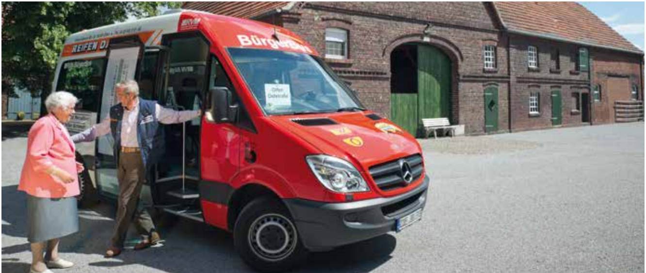
Bürgerbusse stellen neben privatem oder gewerblichem Mitnahmeverkehr eine neue Mobilitätsoption dar.