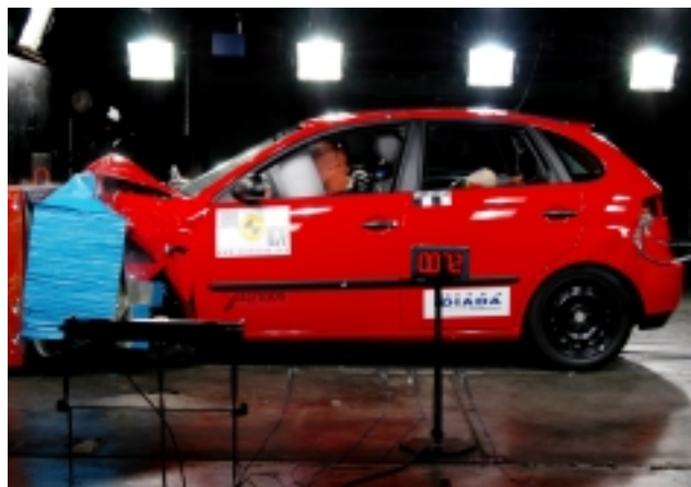
Heller als die Sonne auf Ibiza: Scheinwerferbatterien leuchten den Crashablauf aus, den der Spanier mittelmäßig übersteht

Seitencrash. Beim Seitencrash kamen schon in der Basisversion ohne die Seitenairbags (in Deutschland Serie) gute Werte zustande. 14 von max. 16 Punkten. Ein Pfahlaufprall wurde nicht durchgeführt, da das Fahrzeug keine seitlichen Kopfairbags besitzt.