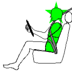
Seitencrash / ☆ = Pfahlaufprall