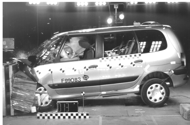
Respekt – das Testergebnis fällt deutlich besser aus, als das Foto erwarten läßt

Frontalcrash: Der Renault Espace war in unserer Reihe der Van mit dem geringsten Verletzungsrisiko für die Insassen. Die Fahrgastzelle ist so stabil, daß sich die Tür auf der Stoßseite nach dem Crash einwandfrei öffnen läßt. Auch mit dem Platz im Fußraum des Fahrers sind die Tester zufrieden: Er bleibt nahezu vollständig erhalten. Kritik gibt es für einige harte Zonen im Aufprallbereich der Fahrerknie, die ein (vermeidbares) Verletzungsrisiko darstellen.