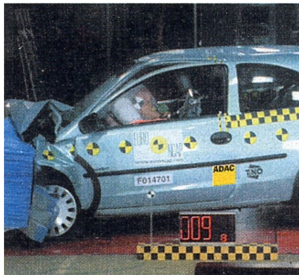
Der silberne Corsa: Schwere Blessuren für's Auto, leichte für die Insassen

Seitencrash. Der getestete Corsa in der Europa-Grundversion besaß noch keine Seitenairbags – bei uns sind sie Serie. Deshalb gehen ihm hier wegen des erhöhten Verletzungsrisikos im Bereich des Bauches und des Beckens Punkte verloren. Der zusätzlich angebotene Kopf-Airbag ist sehr aggressiv: Pfahltest knapp bestanden.