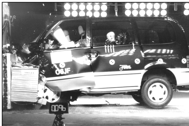
Licht und Schatten: Dem enttäuschenden Frontcrash stehen sehr gute Ergebnisse im Seitenaufprall gegenüber

Frontalcrash: Die Insassenzelle des Nissan Serena bricht im unteren Bereich der Fahrerseite völlig zusammen. Dabei dringen die Pedale weit in den Fußraum ein, und weil gleichzeitig der Fahrersitz (an dem das Gurtschloß befestigt ist!) nach vorn schießt, muß der Fahrer mit hohem Verletzungsrisiko an beiden Füßen rechnen. Obwohl die Lenksäule samt Armaturenbrett deutlich nach oben gerissen wird, kann der Airbag den Kopf noch ausreichend schützen. Die Brust wird gerade noch nicht kritisch belastet, obwohl der Sitz dem Crash nicht standhält und mit dem Gurt nach vorn rückt.