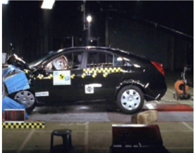
Nicht alles prima beim Primera – aber immerhin 4 Sterne im Gesamtergebnis

Fazit: Der neue Nissan Primera erhält 29 Punkte (gerundet) inklusive einem Zusatzpunkt für ein Gurtwarnsystem am Fahrerplatz und erreicht damit klar 4 Sterne. Beim Fußgängerschutz nur 1 Stern.