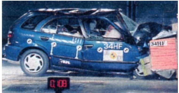
Crashblock getroffen, Ziel deutlich verfehlt: In der passiven Sicherheit versagt der Almera kläglich

Frontalcrash. Der Fahrer ist durch starke Deformationen im vorderen Teil der Fahrgastzelle nicht nur an Becken und Beinen gefährdet. Besonders übel wird bei ihm das Risiko lebensbedrohlicher Brustbelastung eingestuft. Wegen Grenzwertüberschreitung verliert der Almera sogar einen sonst durchaus berechtigten Stern (siehe unten). Das Bremspedal dringt sehr weit in den Fußraum ein, und die Aufprallzonen für die Knie sind zu hart gestaltet.