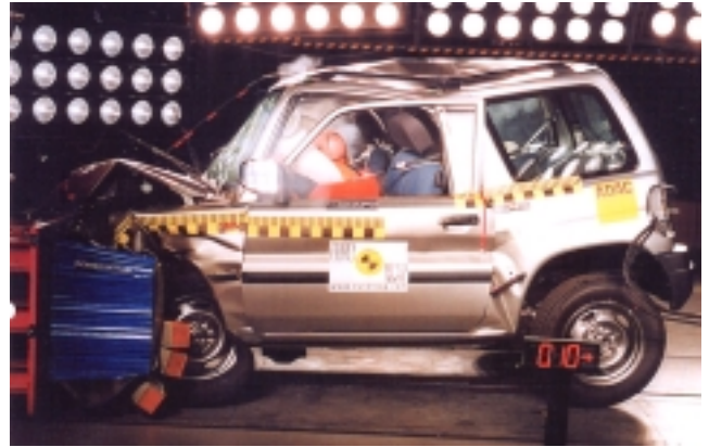
Flott zu Schrott: Der Pinin kann nicht überzeugen

Der gebrochene Lehnenbeschlag könnte den Gurt beschädigen. Unter dem Armaturenbrettbereich lauern harte Teile, die das Verletzungsrisiko für die Beine beim Fahrer erhöhen. Nur 8 von max. 16 Punkten.