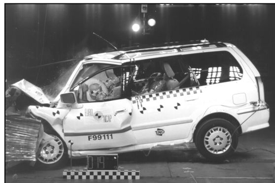
Die Auswertungen zeigen deutlich: Der Überlebensraum in diesem Raum-Fahrzeug ist unzureichend

Frontalcrash: Dem Fahrer des Mitsubishi Space Wagon drohen (bis auf den Kopf) schwere Verletzungen: Weil die Türstruktur beim Biegen völlig aus der Façon geht, schrumpft auch der Fußraum stark zusammen. Zusätzlich wird das Bremspedal nach oben gedrückt und ragt wie ein Spieß nach innen. Die Knie des Fahrers treffen auf harte Armaturenbrettpartien: erhöhtes Verletzungsrisiko für beide Beine. Der Kopf fliegt in den Airbag, bevor der voll entfaltet ist. Fahrer und Beifahrer müssen hohe Brust-Belastungswerte aushalten - die eingebauten Gurtstrammer haben keinen erkennbaren Einfluß.