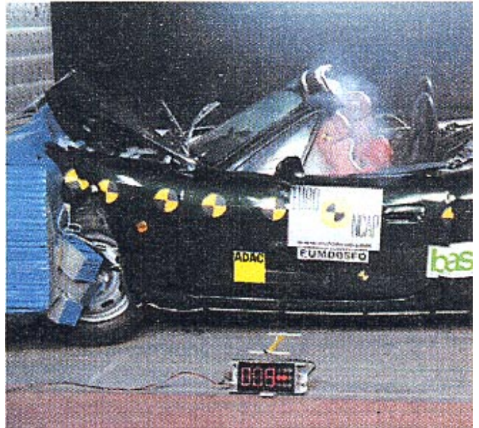
Der MX im Crashtest-Mix: Ganz knapp erreichte er noch 4 Sterne

Seitencrash. Die Belastungen an der Brust des Fahrers sind zwar etwas erhöht, dabei jedoch gleichmäßig verteilt. Auch im Bereich des Bauchs messen die Crashtester leicht erhöhte Werte – trotzdem bleibt es ohne Seitenairbag ein respektables Ergebnis.