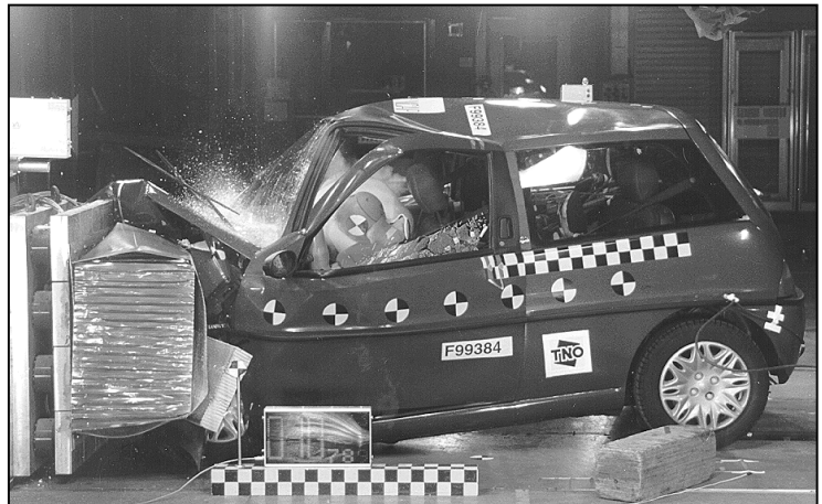
Zu Nebenwirkungen dieses Crashes fragen Sie am besten ihren ADAC: Sie sind nämlich recht bedenklich

Abgesehen davon, dass sich der Überlebensraum zu stark verkleinert, stößt auch die Lenksäule so unbarmherzig gegen die Brust des Fahrers, dass sich der Lenkradbogen stark verbiegt. Das bedeutet hohes Verletzungsrisiko. Ähnliches Ergebnis im Fußraum: Scharfe Ecken und Kanten gefährden die Füße des Fahrers unnötig. Beim Aufschlag der Knie auf den unteren Bereich des Armaturenbretts wird die dicke Gummihaut des Dummys tief eingeschnitten – ein Zeichen dafür, wie wenig hier bei der Konstruktion an passive Sicherheit gedacht wurde.