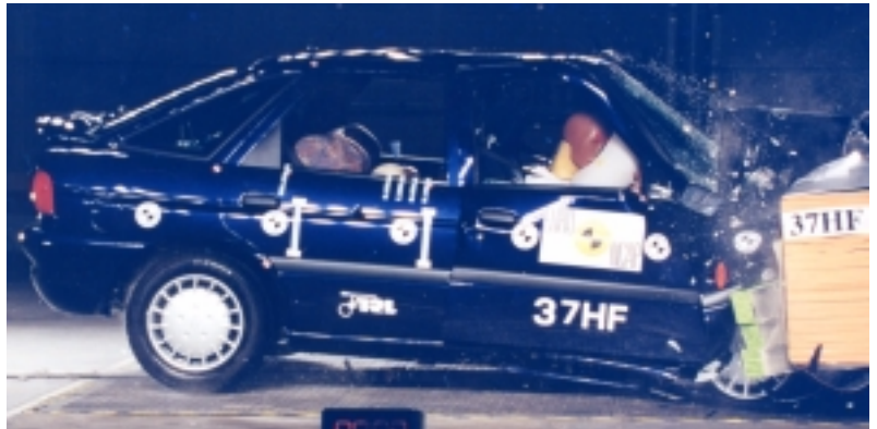
Ford - die tun dem Fahrer (zumindest im Escort) nichts gutes

Frontalcrash. Der Ford Escort bereitet dem Fahrer große Probleme, während der Beifahrer mit Ausnahme der Brust – sie wird bei beiden Insassen gleichermaßen in Mitleidenschaft gezogen – nur geringe Belastungen an Kopf, Hals, Becken und Beinen aushalten muß. Die Fahrgastzelle ist im vorderen Bereich stark deformiert. Das Bremspedal dringt sehr weit in den Innenraum ein und gefährdet die Füße des Fahrers. Das Risiko für Beine und Becken des Fahrers geht vom harten Aufschlag der Knie auf das Armaturenbrett aus.