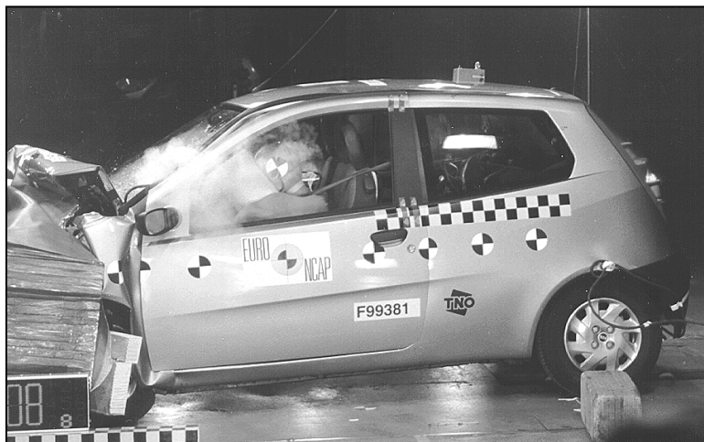
Im Frontalcrash punktet der Punto nur mäßig

hält sich das Verletzungsrisiko auf erfreulich niedrigem Niveau. Das Lenkrad war nach dem Crash leicht verzogen, vermutlich prallte die Brust dagegen. Obwohl die vorderen Sicherheitsgurte mit Kraftbegrenzern gekoppelt sind, wurden im Bereich der Brust bei Fahrer und Beifahrer relativ hohe Belastungswerte gemessen. Da sich die Fahrertür nach dem Versuch öffnen lässt, ist die Bergung der Insassen nach einem frontalen Unfall kein Problem.