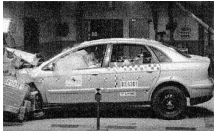
Die Sekunde der Wahrheit: Den Aufprall mit 64 km/h steckt die Karosseriezelle gut weg, die Schwachpunkte zeigen sich bei der Detailauswertung

Die Brust des Fahrers berührte trotz des Airbags noch das Lenkrad – das kann bei einem schweren Unfall das Verletzungsrisiko erhöhen. Auch die harten Strukturteile hinter der Verkleidung unter dem Armaturenbrett gefährden die Knie des Fahrers unnötig. Die Pedalerie verhielt sich dagegen unauffällig, stellt also keine Gefahr dar.