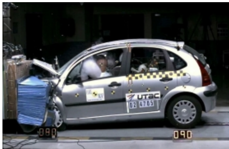
Vitamin C(3): Der Gesundheit, mit leichten Einschränkungen, durchaus förderlich

Frontalcrash: Die Minifahrgastzelle wehrt sich beim Frontalcrash erfolgreich gegen große Verformungen. Einziger höherer Risikofaktor ist der Bereich um die Lenksäule. Das ergibt 13 von max. 16 Punkten.