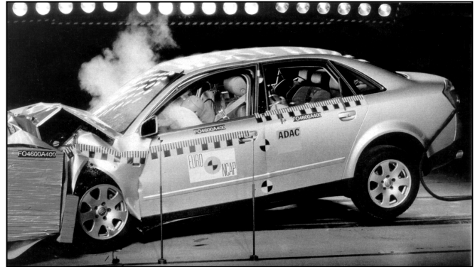
Die Dummies hängen für Millisekunden voll in den Gurten

FRONTALCRASH: Die Vorderere Knautschzone des A4 verdaut den Stoß so gut, dass der Überlebensraum für Fahrer und Beifahrer nahezu vollständig erhalten bleibt. Etwas erhöhte Belastungen messen die Ingenieure im Bereich von Brust und Oberschenkel des Fahrers – ein Hinweis darauf, dass die Abstimmung zwischen Lenkradairbag und Sicherheitsgurt noch nicht perfekt ist. Außerdem ist der Kniebereich noch nicht genügend entschärft: Verletzungsrisiken gehen vor allem vom Zündschloss und vom Mechanismus der Lenksäulen-Verstellung aus. Aus diesem Grund haben die Euro-NCAP-Inspektoren nachträglich zwei Punkte abgezogen. Trotzdem liegt der Audi mit 12 von 16 möglichen Punkten nicht nur in seiner Klasse sehr gut im Rennen.