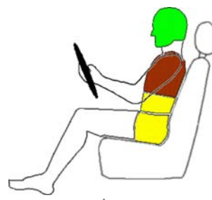
Seitencrash / ☼ = Pfahlaufprall