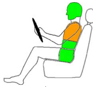
Seitencrash / ☼ = Pfahlaufprall