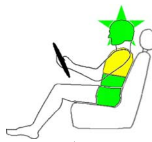
Seitencrash / ☆ = Pfahlaufprall