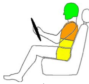
Seitencrash / ☆ = Pfählaufprall