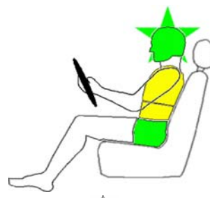
Seitencrash / ☼ = Pfahlaufprall