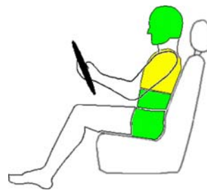
Seitencrash / ☆ = Pfahlaufprall