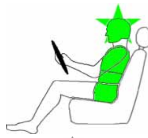
Seitencrash / ★ = Pfahlaufprall