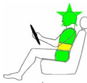
Seitencrash / ☆ = Pfahlaufprall