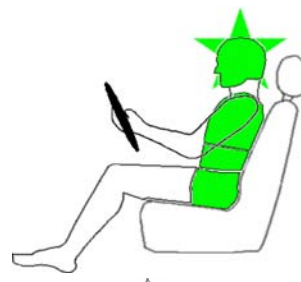
Seitencrash / ☼ = Pfahlaufprall