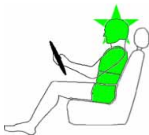
Seitencrash / ☛ = Pfahlaufprall