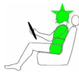
Seitencrash / ☼ = Pfahlaufprall