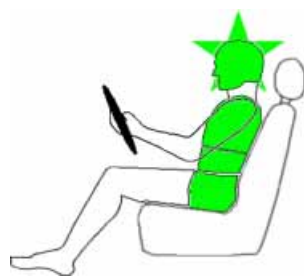
Seitencrash / ☼ = Pfahlaufprall