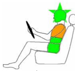
Seitencrash / ⚡ = Pfahlaufprall