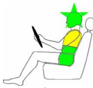
Seitencrash / ☼ = Pfahlaufprall