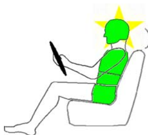
Seitencrash / ⚡ = Pfahlaufprall