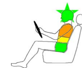
Seitencrash / ☆ = Pfahlaufprall