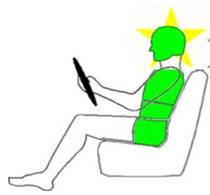
Seitencrash / ⚡ = Pfahlaufprall