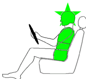
Seitencrash / ☆ = Pfahlaufprall