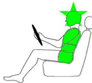
Seitencrash / ☆ = Pfahlaufprall