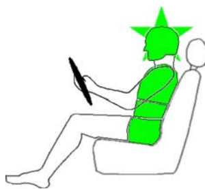
Seitencrash / ⚡ = Pfahlaufprall