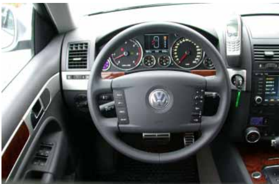
Die Bedienung ist einfach und funktionell, die Verarbeitung und Materialanmutung auf hohem Niveau.