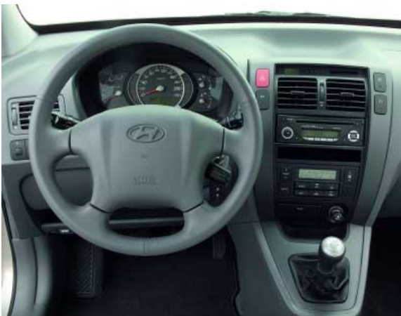
Der Fahrerplatz des Tucson besitzt ein zeitgerechtes wenn auch nicht sehr hochwertiges Design. Trotz der Neukonstruktion ist die Bedienung nicht sehr funktionell und lässt Raum für Verbesserungen.