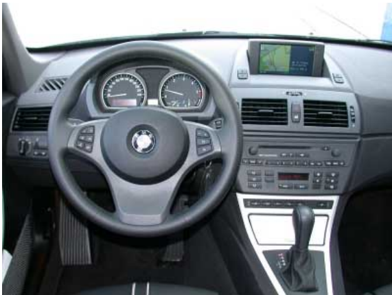
Der Innenraum des X3 folgt der neuen BMW-Designlinie, fällt jedoch nicht so wuchtig aus wie in den 5er oder 7er-Modellen.