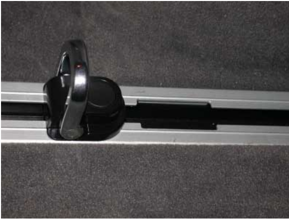
Mit dem sinnvollen, jedoch aufpreispflichtigen Schienensystem lassen sich Gepäckstücke sicher befestigen.