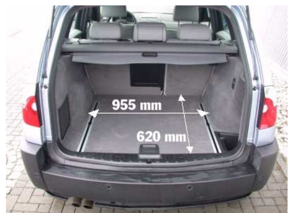
Mit 420 l Volumen ist der Kofferraum geringfügig größer als der des X5.