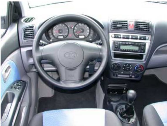
Hier gibt es nur wenig zu bemängeln, das Design entspricht europäischen Standards.