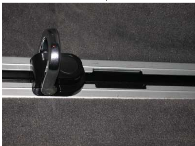
Mit dem sinnvollen, jedoch aufpreispflichtigen Schienensystem lassen sich Gepäckstücke sicher befestigen.