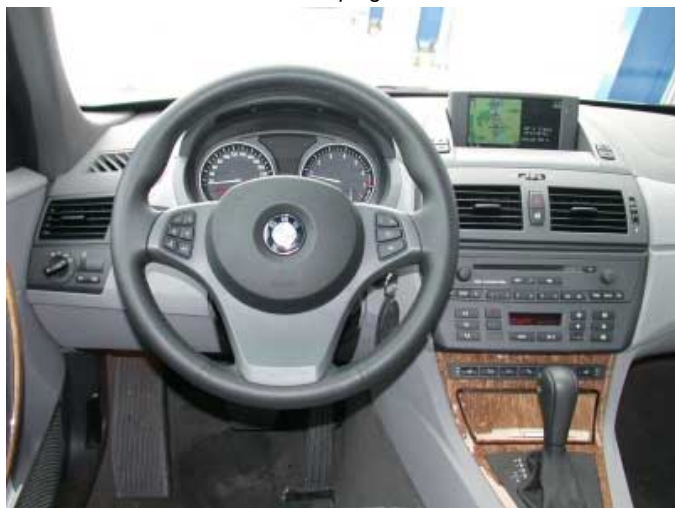
Der Innenraum des X3 folgt der neuen BMW-Designlinie, fällt jedoch nicht so wuchtig aus wie in den 5er oder 7er-Modellen.

und blendet bei hellem Scheinwerferlicht automatisch ab.