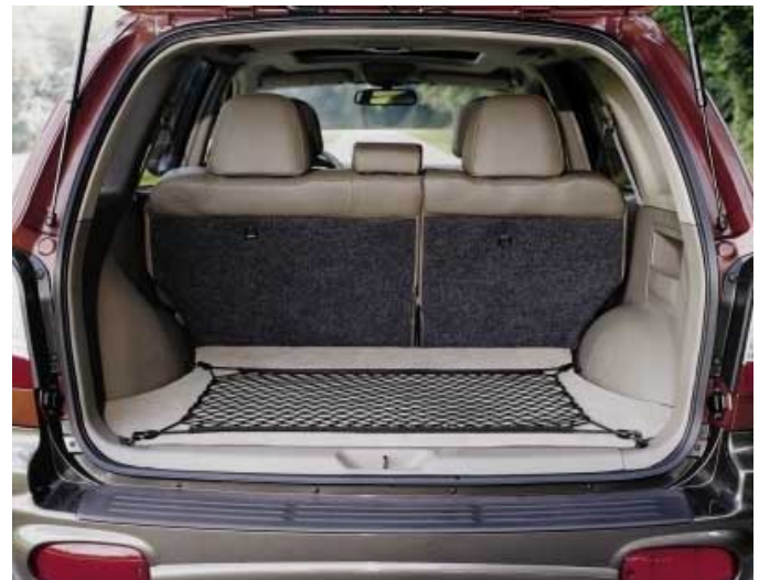
Mit 425 l Volumen kann der Kofferraum des Santa Fe überzeugen.