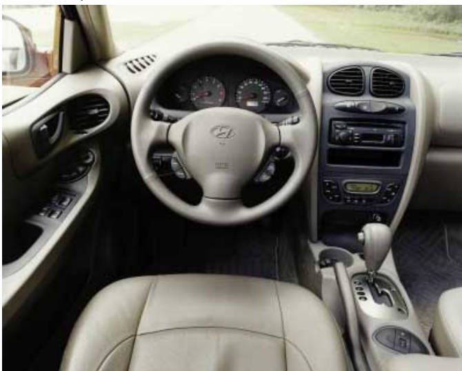
Modernes, funktionelles Design prägt den Santa Fe.