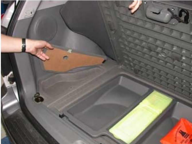
Unter dem Kofferraumboden finden sich sinnvolle Fächer für Kleinteile und das Warndreieck.

Die Kopfstützen müssen zum Umklappen abgezogen werden, es stehen keine Halter zur Verfügung. Nach dem Umklappen ist der Kofferraum nach vorne ansteigend. Weder Skisack noch Durchladelupe sind erhältlich.