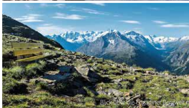
Blick über die Engadiner Bergwelt nahe der Segantinihütte - Graubünden