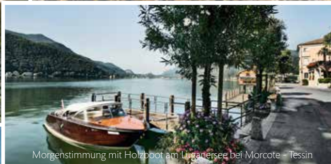
Morgenstimmung mit Holzboot am Luganersee bei Morcote - Tessin