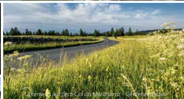
Unterwegs auf dem Col du Marchairuz - Genferseegebiet