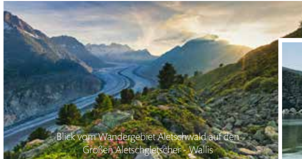
Blick vom Wandergebiet Aletschwald auf den Großen Aletschgletscher - Wallis