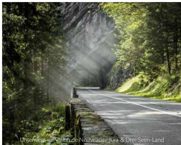
Unterwegs im Vallon de Noirveaux - Jura & Drei-Seen-Land