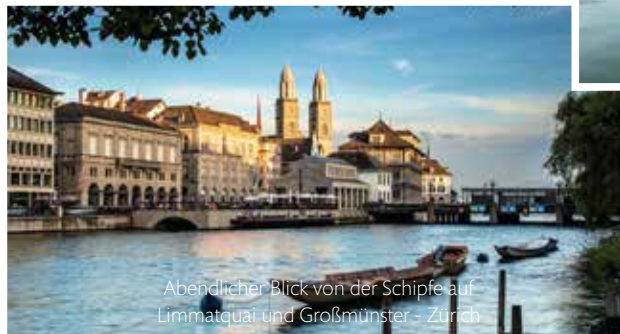
Abendlicher Blick von der Schipfe auf Limmatquai und Grossmünster - Zürich