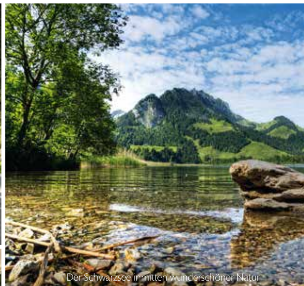
Der Schwarzsee inmitten wunderschöner Natur