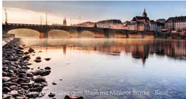
Morgennebel über dem Rhein mit Mittlerer Brücke - Basel