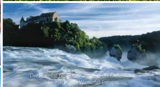
Der Rheinfall bei Schaffhausen in der Ostschweiz, der mächtigste Wasserfall Europas