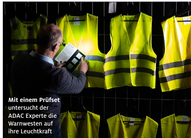
Mit einem Prüfset untersucht der ADAC Experte die Warnwesten auf ihre Leuchtkraft

Ob die Reflexionsstärke ausreichend ist, kann man in einem einfachen Selbsttest mit Taschenlampe oder Smartphone-Lampe checken. Eine gute Warnweste sollte im Abstand von etwa drei Metern strahlend weiß reflektieren. Der ADAC bietet diesen Test mit einem Prüfset in allen Geschäftsstellen in der Pfalz und in Koblenz an.