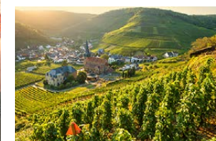
Mittendrin Mayschoß an der Ahr

Der Rotweinwanderweg im Ahrtal gilt seit mehr als 30 Jahren als eines der beliebtesten Ausflugsziele Deutschlands. Auf einer Strecke von 35 Kilometern führt er meist auf halber Höhe durch die Weinbergterrassen von Bad Bodendorf über Bad Neuenahr/Ahrweiler bis Altenahr. Man hat wunderschöne Ausblicke in das Ahrtal und kann den Winzern bei der Arbeit zusehen. Es gibt viele öffentliche Stellplätze. Schöner ist es vielleicht direkt beim Winzer – zum Beispiel auf dem Weingut Sonnenberg in Bad Neuenahr-Ahrweiler, das auch geführte Weinwanderungen anbietet.