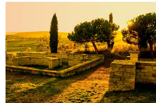
Das Römische Weingut Weilberg soll vor fast 2000 Jahren eine gewaltige Frontlänge von 150 Metern gehabt haben