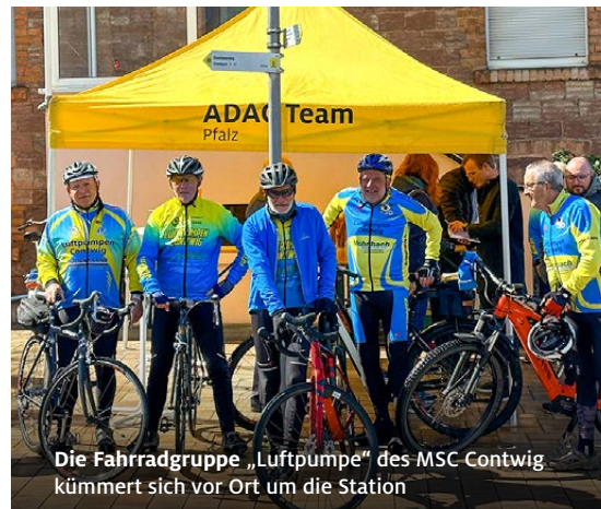
Die Fahrradgruppe „Luftpumpe“ des MSC Contwig kümmert sich vor Ort um die Station

auf den neuen Trend ein und bieten beispielsweise Gepäcktransfer und Fahrradverleih sowie Lunchpakete für die Radtouren an.