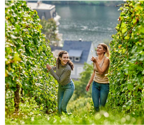
Zwischen den Reben In den Weinbergen bei Traben-Trarbach

Fernab von Lärm und Alltagshektik liegt in Longuich das Weingut Feiten inmitten von Weinbergen und Apfelplantagen. Der Stellplatz bietet Platz für 40 Wohnmobile und ist nur 30 Meter vom Moselradweg entfernt. Vom Stellplatz aus haben Urlauber einen direkten Blick auf die Mosel und die vorbeifahrenden Schiffe. Im Weingarten mit Panoramaterrasse wird Leckerer serviert. Beliebte Ausflugsziele von hier sind Bernkastel-Kues, die mittelalterliche Stadt des berühmten „Doctor-Weines“, und Koblenz mit viel moselfränkischem Fachwerk.