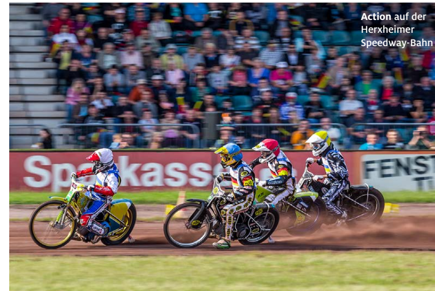
Action auf der Herxheimer Speedway-Bahn

> Alle Infos unter adac.de/saarland und tuv.com/saarland