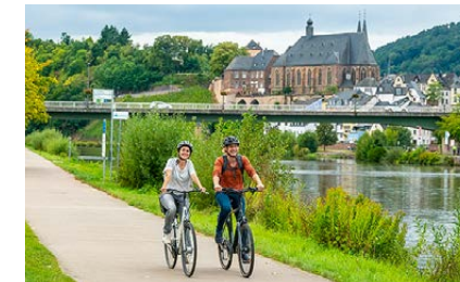
Auf dem Saar-Radweg Die Route führt durch eine herrliche Umgebung mit sonnenbeschienenen Weinbergen

Auf dem „Skywalk“ Hier oben liegt ein Bernkastel-Kues zu Füßen