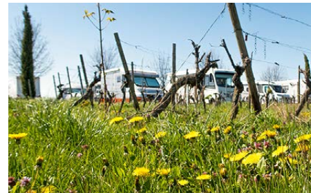
Ein Glück für Wohnmobil-Urlauber: Camping mit Weingenuss