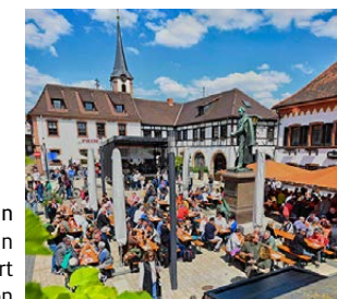
Maikammer in der Pfalz ist ein bekannter Weinort mit viel Tradition