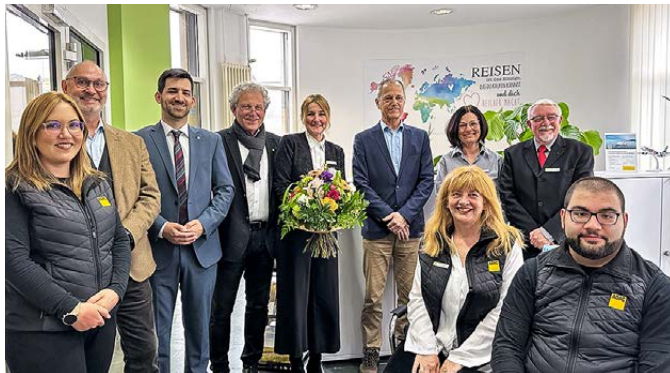
Eröffnung des neuen ADAC Reisebüros in Saarlouis Die Mitarbeitenden mit den Gratulanten aus Politik und Wirtschaft, Mitgliedern, Kundinnen und Kunden

Schon beim Betreten der Räumlichkeiten kommt Urlaubsstimmung auf: Das neue ADAC Reisebüro in Saarlouis direkt gegenüber der ADAC Geschäftsstelle bietet Reiseberatung und Buchung für alle