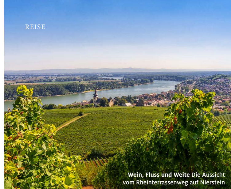
Wein, Fluss und Weite Die Aussicht vom Rheinterrassenweg auf Nierstein

➤ Weitere Informationen unter rlp-tourismus.de/rheinhessen