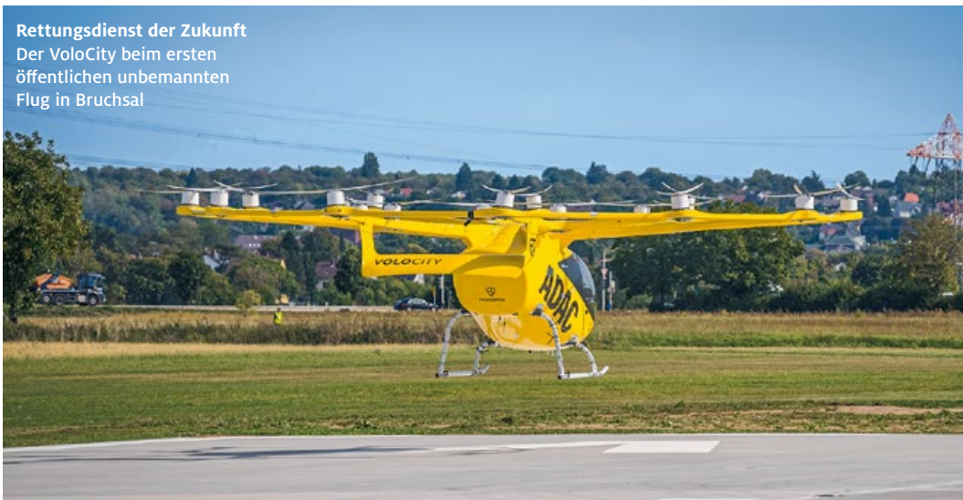
Rettungsdienst der Zukunft Der VoloCity beim ersten öffentlichen unbemannten Flug in Bruchsal

Der VoloCity hat 18 einzeln elektrisch angetriebene Propeller, die auf einer Ebene über der Kabine verteilt sind, in die zwei Personen, Pilot und Notarzt, passen. 110 km/h schnell, liegt derzeit die Reichweite des VoloCity bei rund 35 Kilometern. Da der Multikopter den Rettungshubschrauber nicht ersetzen wird, sondern die schnelle Hilfe aus der Luft ergänzt, wird in Idar-Oberstein weiterhin der in Imsweiler >