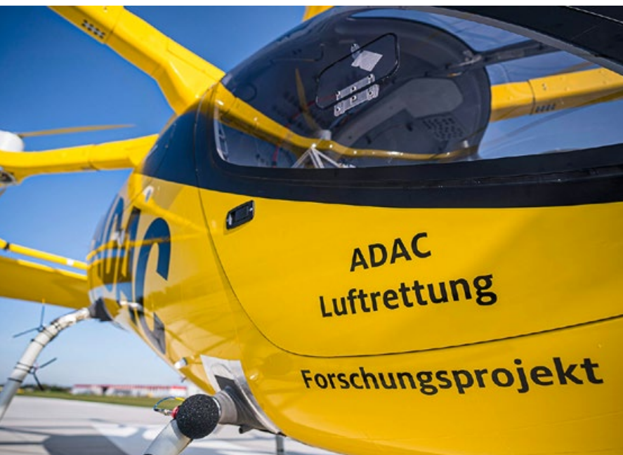
Der VoloCity bietet Platz für Pilot und Notarzt

Mit diesem Schritt leistet die ADAC Luftrettung nicht nur in Rheinland-Pfalz Pionierarbeit, sondern weckt auch weltweites Interesse. So hat der Klinikverbund der Pariser Krankenhäuser bereits Interesse bekundet, das Multikopter-Konzept der ADAC Luftrettung nach einem erfolgreichen Start in Deutschland auch in Frankreich zu testen.