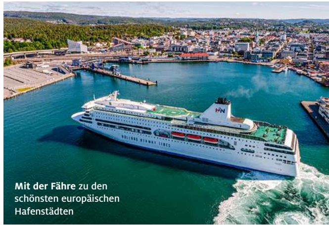
Mit der Fähre zu den schönsten europäischen Hafenstädten

Eine Reise mit der Fähre ist mehr als nur eine Überfahrt von A nach B. Komfortabel ausgestattete Kabinen, ansprechende Bordrestaurants und Entspannungsmöglichkeiten machen daraus den ersten Höhepunkt des Urlaubs. Besonders bequem können Fahrtickets nach Griechenland, Großbritannien, Skandinavien (NEU: von Emden nach Kristiansand mit Holland Norway Lines schon für 2024 buchbar), Italien, Marokko und Tunesien online gebucht werden. ADAC Mitglieder profitieren von Vorteilspreisen bei zahlreichen Partnern (adac-fahren.de/vorteilsprogramm).