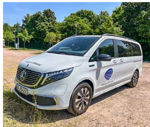
Geräumige Vans stehen für Menschen mit Rollstuhl, größere Gruppen oder Transporte zur Verfügung