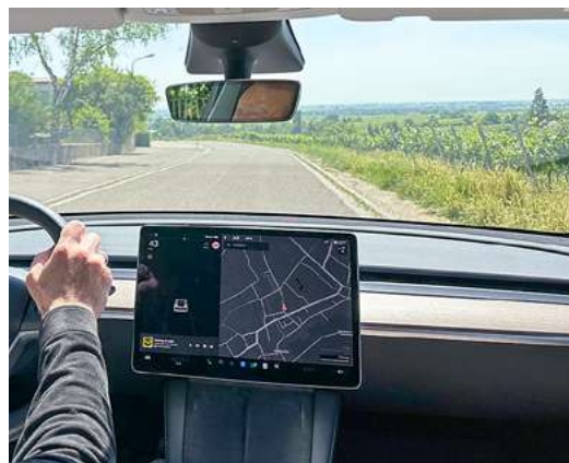
Als flexible Ergänzung zum ÖPNV bietet der Fahrdienst vor allem in ländlichen Gebieten Sicherheit und Komfort

Das ist eine Frage der Gesamtkalkulation und der Gesamtrechnung. Man muss die Kosten des Privatfahrzeugs im Jahresunterhalt betrachten. Das beinhaltet nicht nur Sprit, sondern auch Steuern, Versicherung und Werkstattkosten. Dazu kommen weitere Aspekte wie Parkplatznot vor Ort oder Ähnliches. Die Kosten für Fahrten mit MoD werden auf Basis des günstigen Luftlinien-VRN-e-Tarifs zuzüglich einer Gebühr schon vor Fahrtantritt in der App angezeigt und