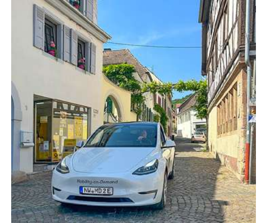
Mobility-on-Demand Rund um die Uhr umweltfreundlicher Fahrservice in Neustadt, seinen Weindörfern und weiteren Gemeinden an der Weinstraße

Wir sind in der Tat eines der wenigen Unternehmen, die innerhalb des ÖPNV, aber dennoch eigenwirtschaftlich ein On-Demand-Angebot im ländlichen Raum bereitstellen. Einige