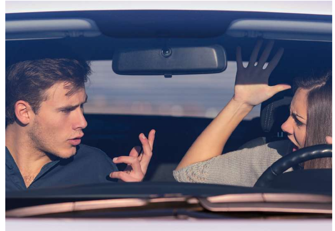
Nicht nur ein Streit, sondern auch intensive Gespräche mit dem Beifahrer können die Aufmerksamkeit vom Verkehrsgeschehen gefährlich ablenken