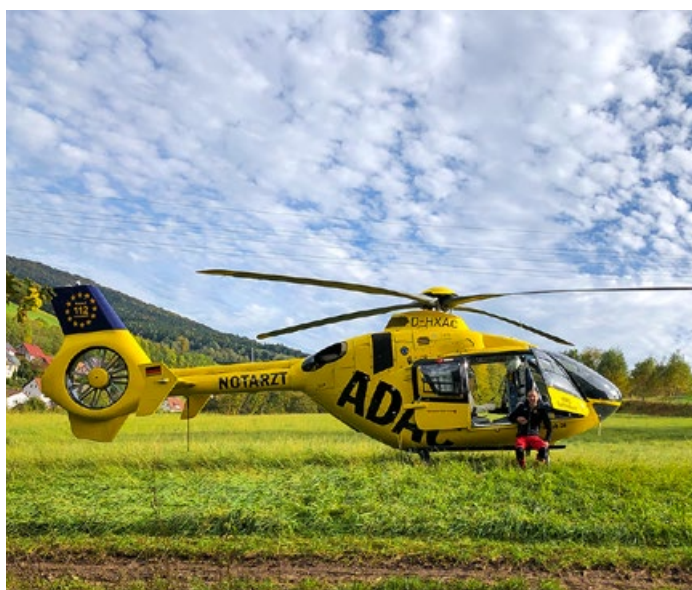
Am Einsatzort gelandet „Christoph 28“ fliegt von Fulda aus mit 70 Kilometern Radius in Osthessen, Südthüringen und Unterfranken